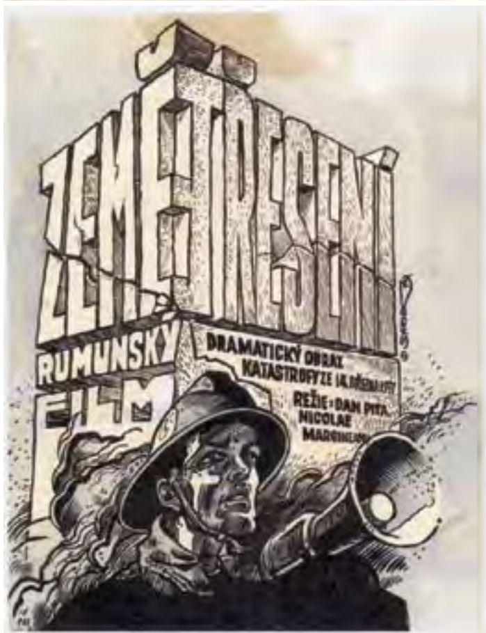
Kája Saudek: Nahoře plakát k filmu „Kdo chce zabít Jessii?“, ve kterém byly užity autorovy komiksové kresby..., 1966 / Dole nerealizovaný návrh plakátu, 1979 / Vpravo: „Čtyři vraždy stačí, drahoušku“ na obálce katalogu výstavy, ve kterém jsou reprodukovány všechny Saudkovy plakáty