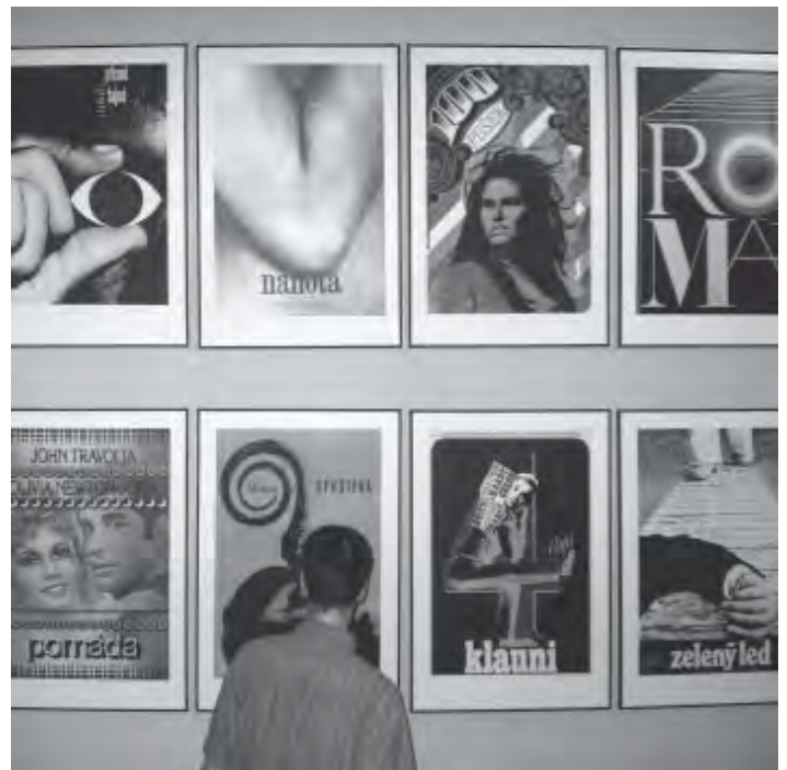
Z výstavy filmových plakátů Z. Zieglera (více viz s. 2)

Vydává nejen pro své členy Sdružení Bienále Brno, profesní organizace grafiků-designérů, člen Icograda a člen UVU ČR / „Bienále Brno“ je registrovaná ochranná známka SBB