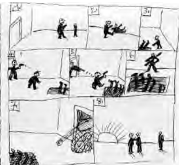
Lotynka /kresba oropiskou/ 1982