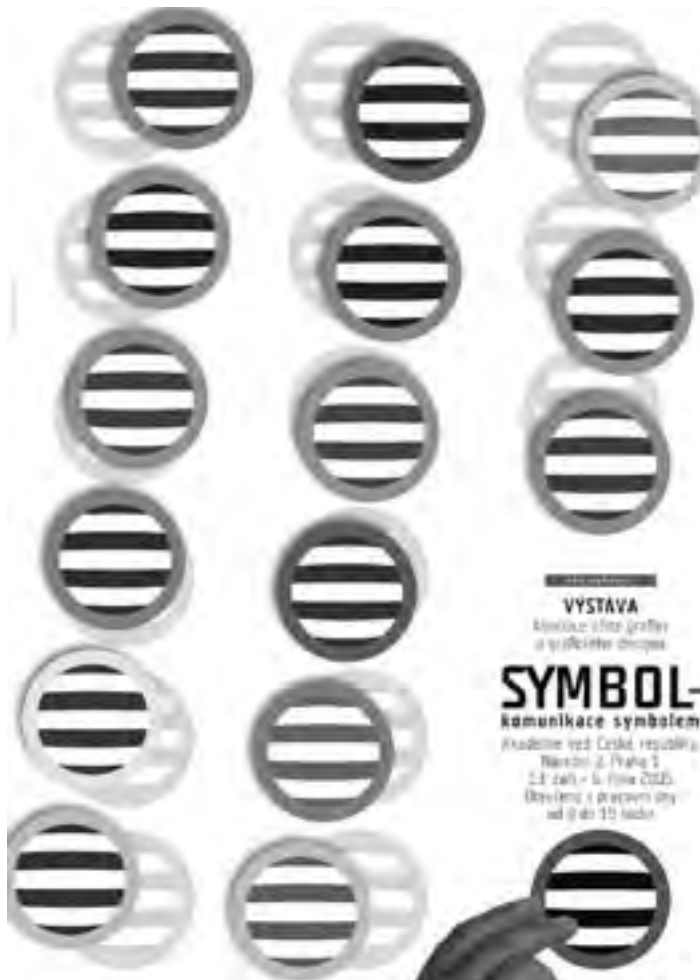
GaLERIE ČAK: pokračování výstavy Symbol v paláci Dunaj na Národní třídě (dvě fotografie vlevo nahoře) Pět výkladců paláce Dunaj nese toto označení, „a“ je použito ze znaku České advokátní komory (vlevo)