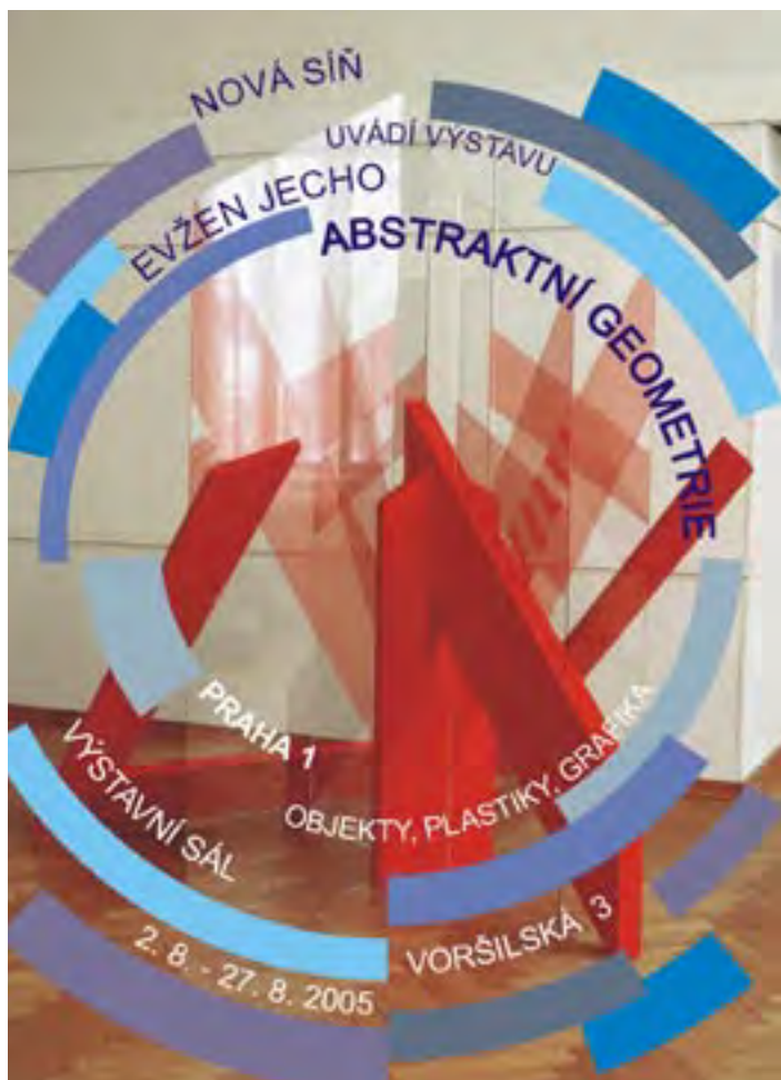
Posterem se vracíme k srpnové výstavě člena SBB Evžena Jecha v pražské Nové síni

Sdružení Bienále Brno, Jiráskova tř. 4, 602 00 Brno