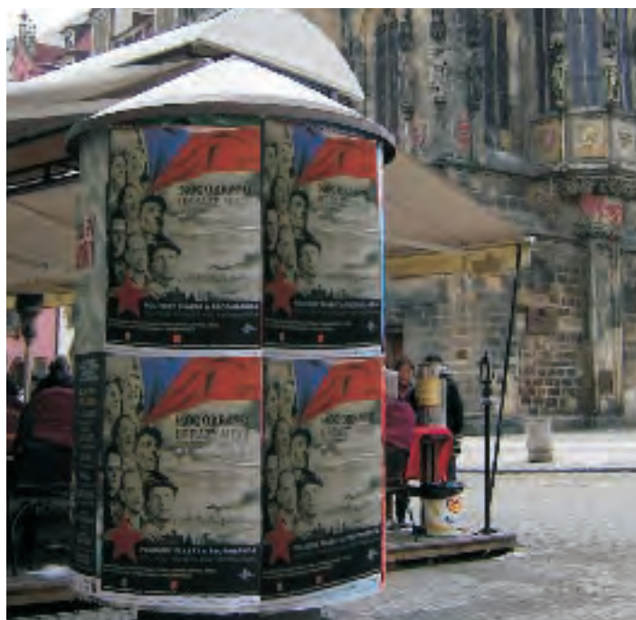
Od konce ledna byla Praha doslova zaplavena stovkami plakátů a citylightů výstavy „Politický plakát a propaganda: moc obrazů – obrazy moci“ – viz ilustrativní foto ze Staroměstského nám.