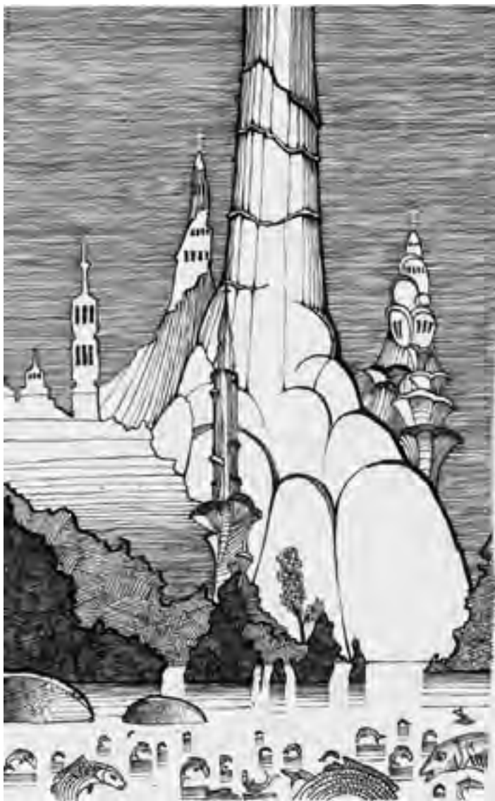
Ilustrace Pavla Lukáše (studenta ateliéru grafického designu na brněnské FaVU VUT) k Miliónu Marca Pola