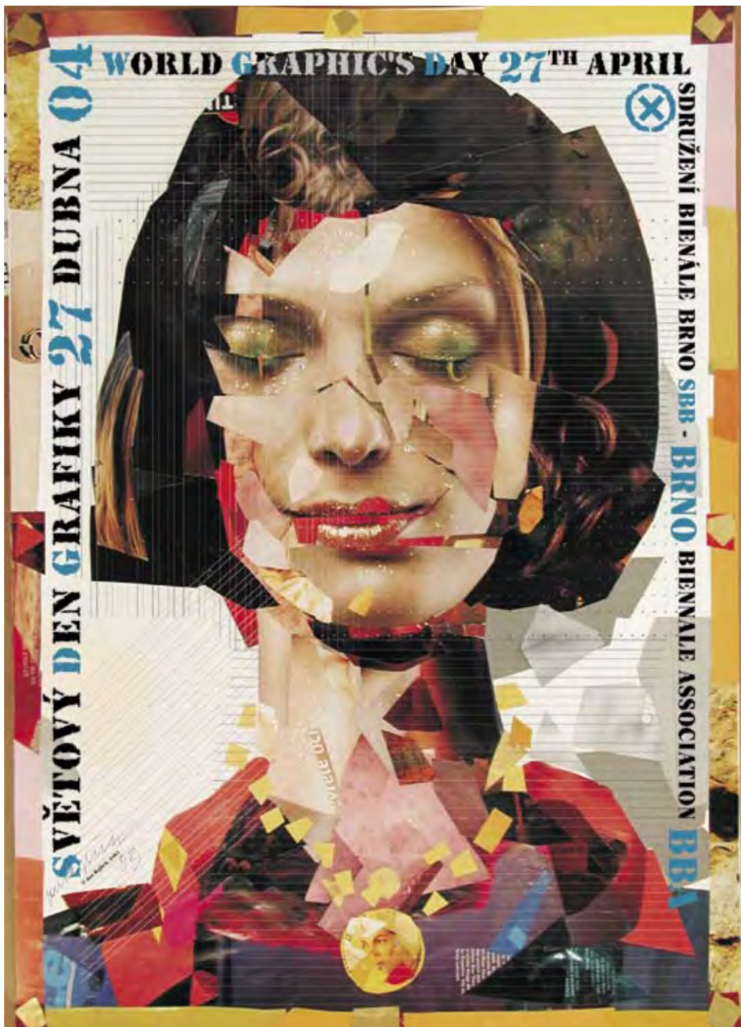
Jan Rajlich st.: Světový den grafiky 2004, plakát, 98x65 cm, ofset.

Plakát je v omezeném množství k dostání na adrese SBB.